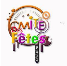
Comité des fêtes Loire Saint Marc