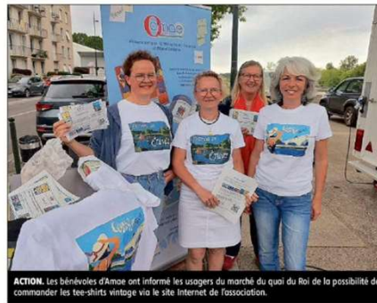
ACTION. Les bénévoles d'Amæe ont informé les usagers du marché du quai du Roi de la possibilité de commander les tee-shirts vintage via le site Internet de l'association.