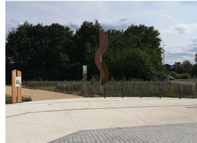
Totem du vivant - Thomas Formont